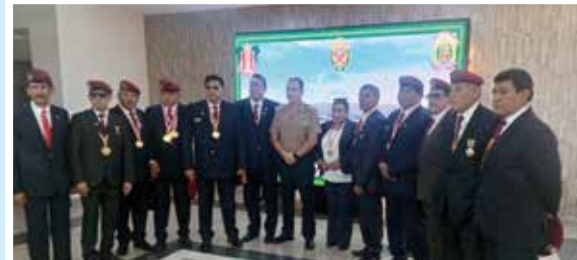
Ceremonia del día del Policia en situacion de retiro en la region de Arequipa.